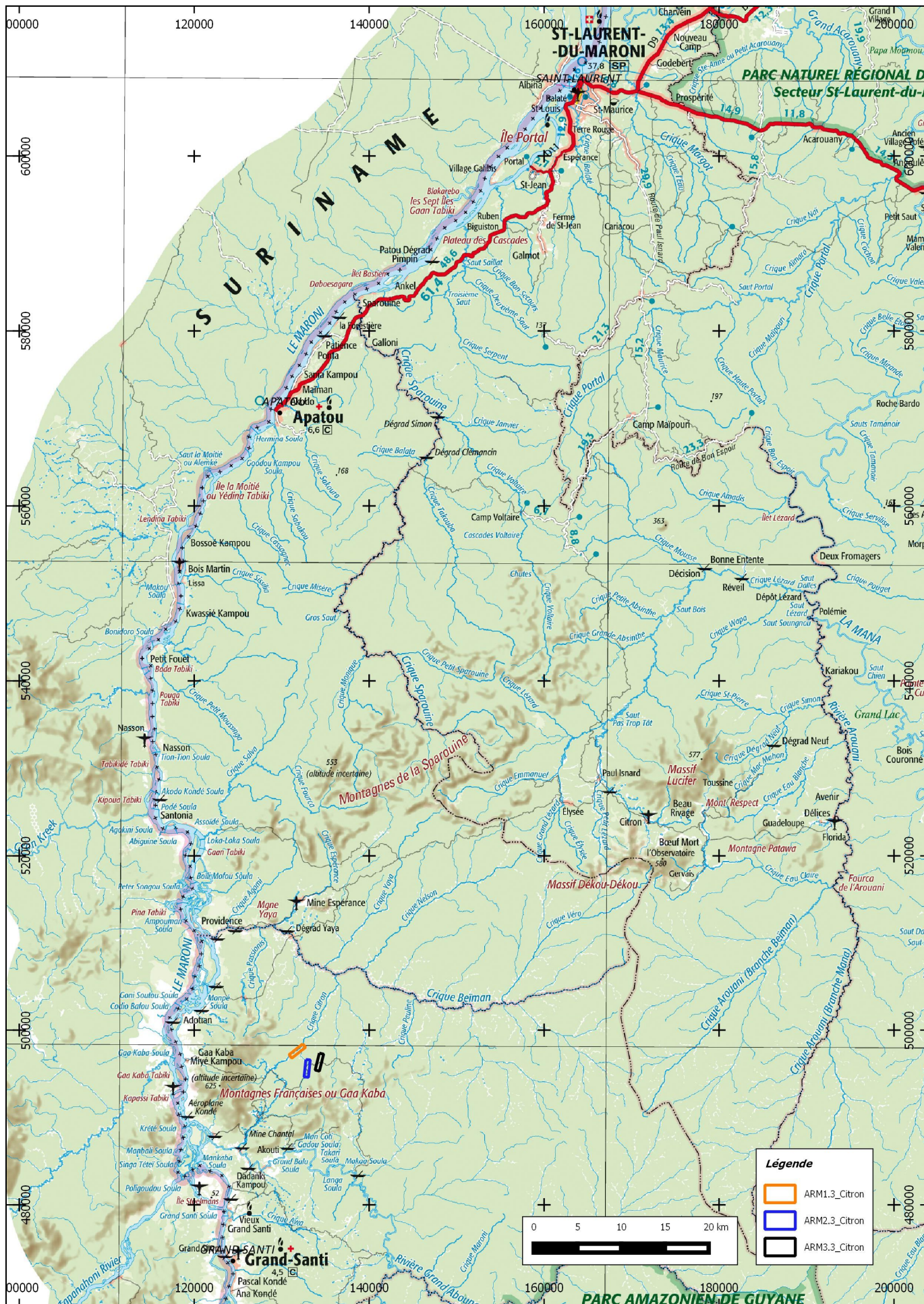
Carte de localisation de l'ARM Crique Citron, SAS PHOENIX, d'après la carte IGN au 1/500 000° en RGFG95 UTM22